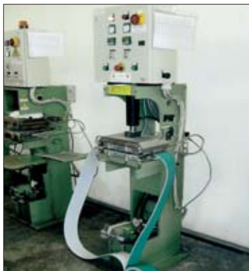
Profesionální svařovací zařízení